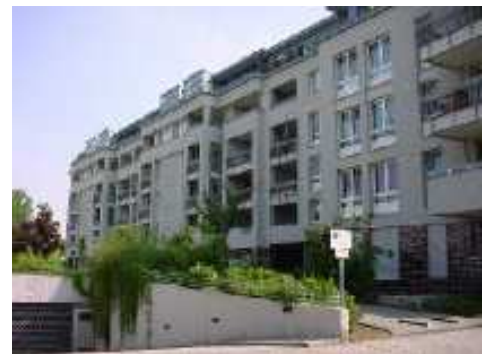
Galerien und Dachterrassen