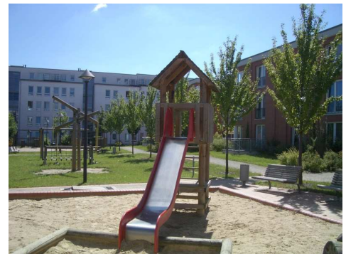
Stadtvillen mit Grünanlagen und Spielplatz

Die Wohnungen am Landsberger Tor bieten Lebensqualität, die man sich leisten kann. Dieses Wohngebiet zeichnet sich aus durch eine ansprechende Gesamtanlage in höchstens vier-geschossiger Bauweise mit großzügigen Grünflächen innerhalb der Siedlung und natürlich mit Spielplätzen für die Kleinen. Die Wohnungen wurden mit öffentlichen Mitteln gefördert und vorrangig für den Bedarf von Familien mit Kindern konzipiert und gebaut.